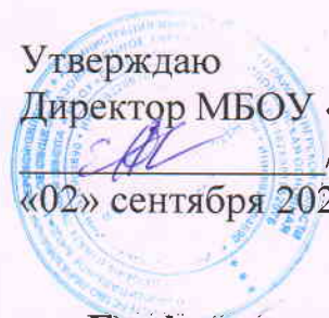
График питания обучающихся в МБОУ «Сидорковская основная общеобразовательная школа» на 2024-2025 учебный год